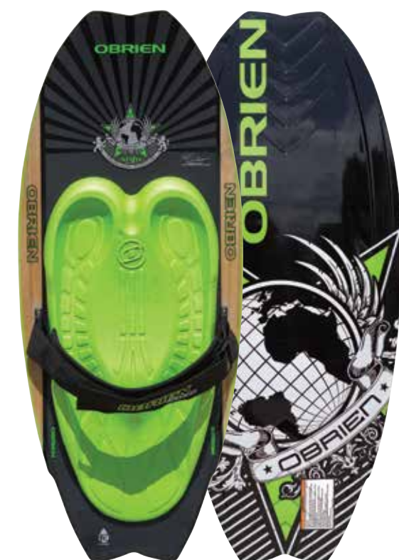
SOZO 639,90 €