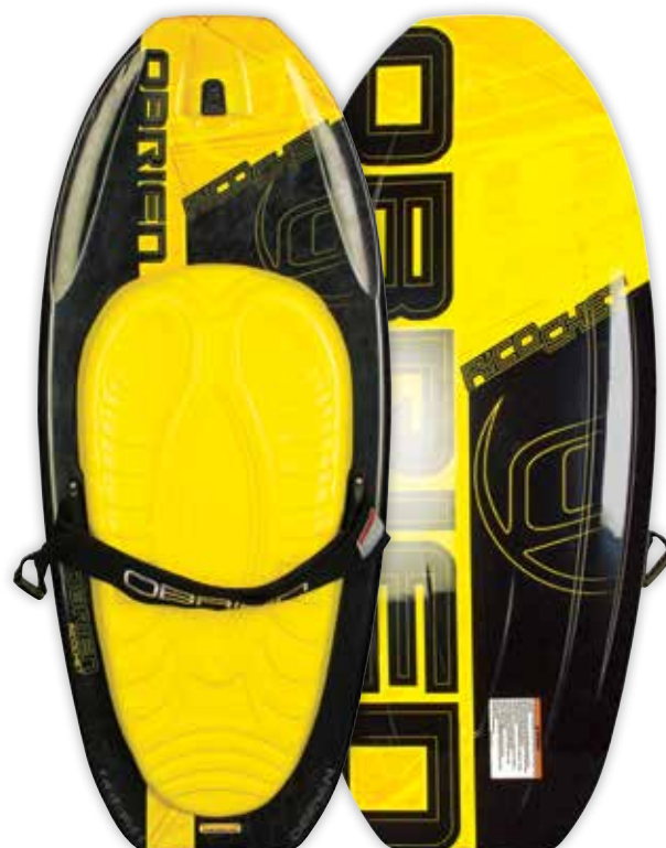
RICOCHET 349,90 €

Le SOZO est l'arme absolue en matière de KNEEBOARD. Sa conception FUSION CORE a permis d'atteindre un niveau de performance jamais égalé grâce à sa légèreté. Son extraordinaire Flex emmagasine et restitue parfaitement l'énergie initiée par le rider. Le SOZO, c'est l'alliance parfaite de la maniabilité et de l'explosivité.